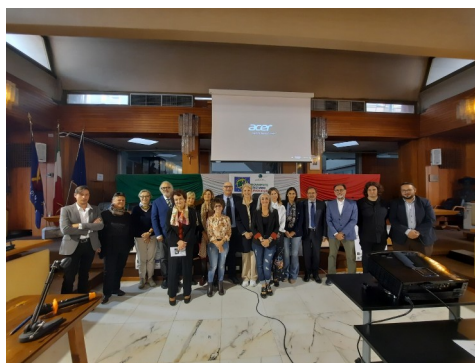
premiazione edizione precedente

Comitato Organizzatore: Circolo MCL-AGHINOLFI aps - ETS Sede legale: Via traversa 8-10 – 54038 Montignoso (MS) Sede Operativa: Via del Patriota 22/2 – 54100 Massa (MS) tel. +39 3453845138 indirizzo mail: premio.leali.aghinolfi@gmail.com